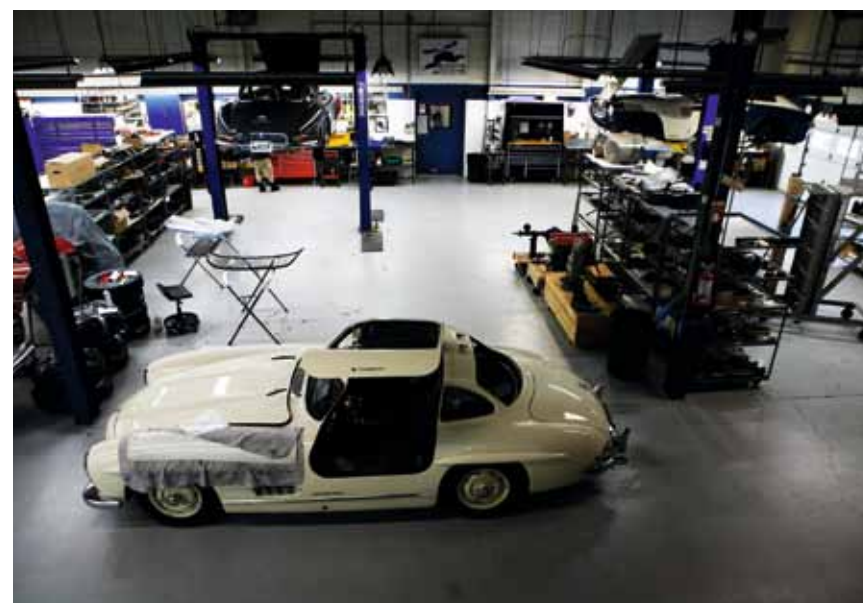
GULLWING: Selskapet startet som «Gullwing Service Company». Det er ikke mange steder du finner flere eksemplarer av måkevingebilen enn her – inne til service og vedlikehold.