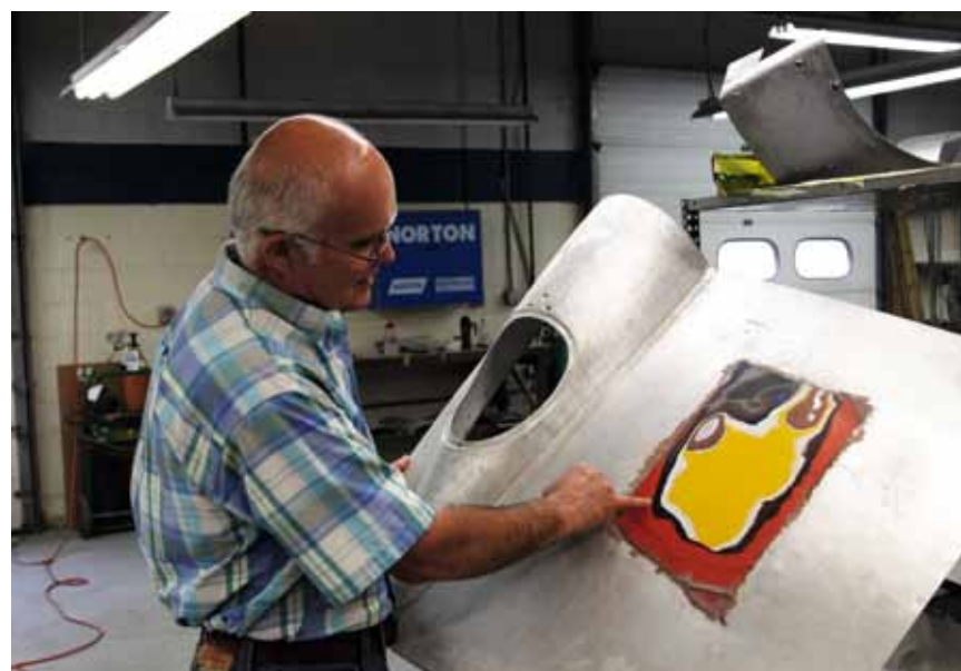
GRUNDIG RESEARCH: Når en Ferrari 250 TR med et rikt liv skal restaureres gjelder det å finne opprinnelsen – gjerne under en håndfull lag med lakk.