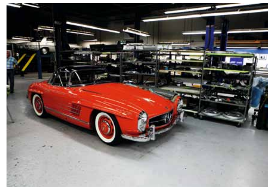
URØRT ORIGINALBIL: Denne nydelige 300 SL Roadster er kun kjørt noen tusen miles siden den var ny og holdes kun ved like – i perfekt originalstand.