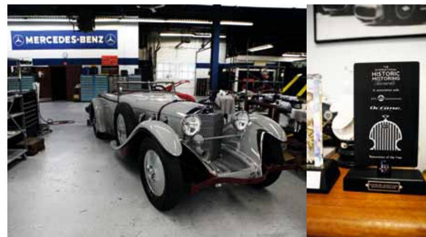
VERDENS FINESTE: Denne 1928 Mercedes-Benz 680 S Saoutchik Torpedo Roadster ble kåret til den beste restaureringen i verden i 2012. Kommer til Concours of Elegance i London første helgen i september.