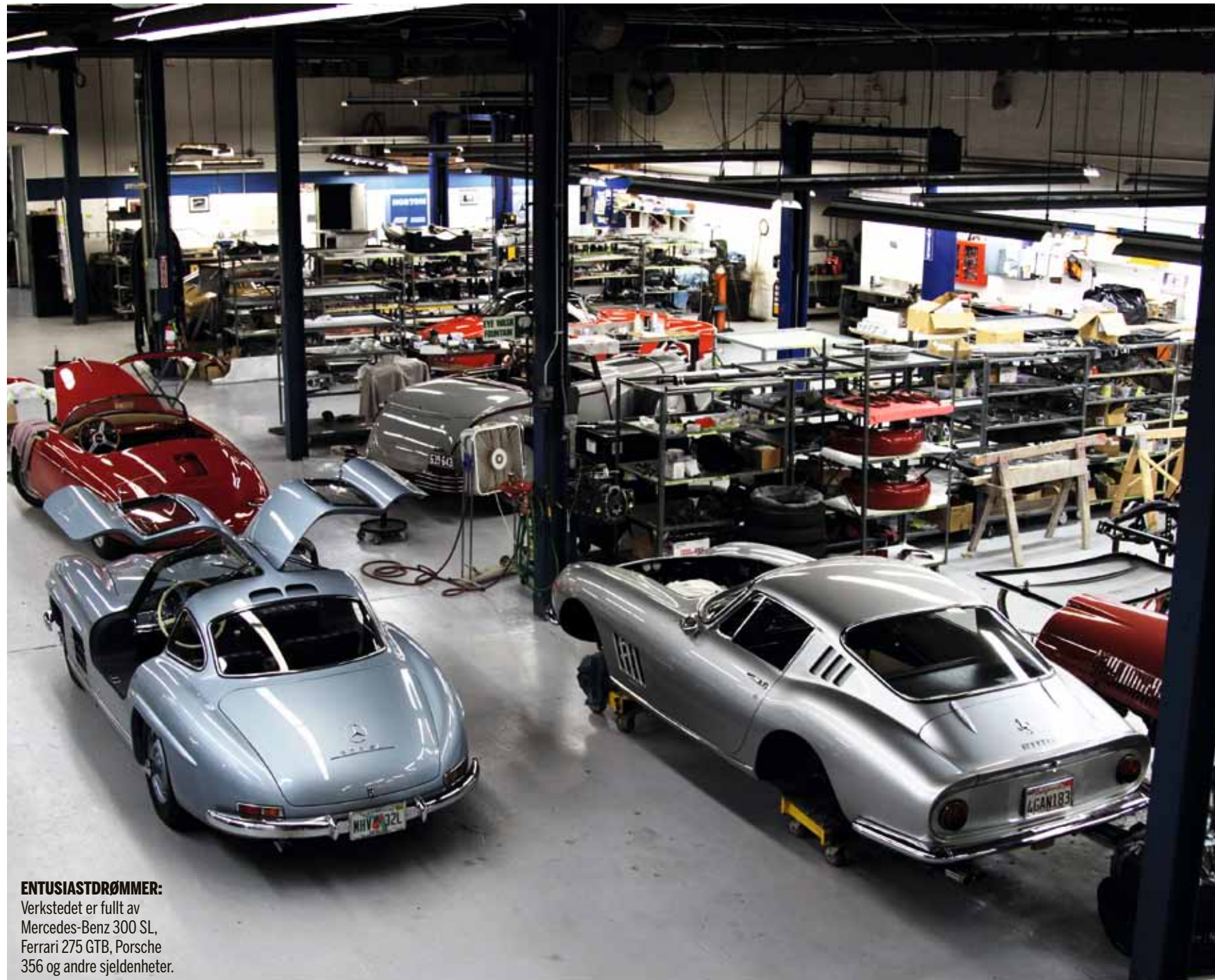
ENTUSIASTRØMMER: Verkstedet er fullt av Mercedes-Benz 300 SL, Ferrari 275 GTB, Porsche 356 og andre sjeldenheter.