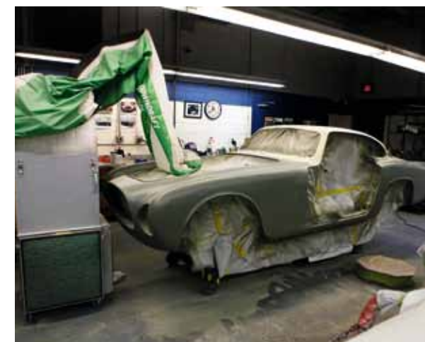
NYE PROSJEKTER: Ferrari utgjør stadig større del av de store restaureringene. 212 Vignale Coupé og 410 Superamerica skal være klare til 2015.